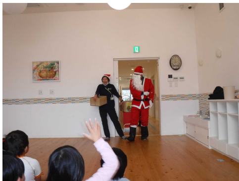
サンタクロース登場！！