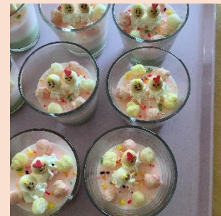
おやつもおひなさま