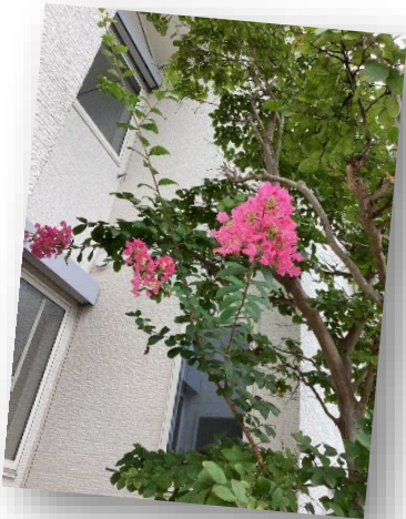
夏のおわりのサルスベリ

今年の秋の訪れは彼岸花が彼岸を過ぎても「とことこ」周辺では見かけることがなかったのですが、近隣の田んぼの畔にポツリポツリと可憐な赤い花を見つけました。また、とことこのサルスベリの花が、今年は開設以来最高の花をつけ楽しませてくれています。ようやくきた秋を感じて「とことこ」の子どもたちはそろそろ散歩に出かける計画を、10月と言えば「ハロウィン」も準備を始めています・・・